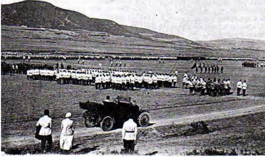
Парад в ГАЛЛИПОЛИ, Resim 3: Gelibolu'da askeri geit t6reni