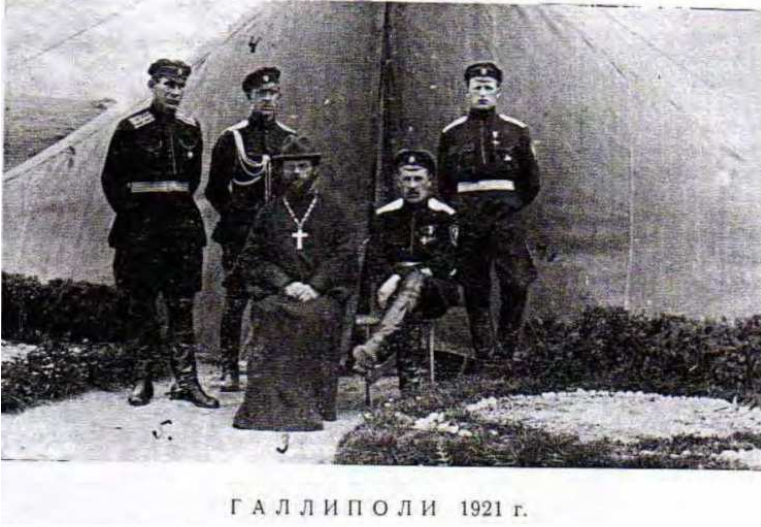
Resim 1: Gelibolu 1921. Rus askerleri ve keşiş