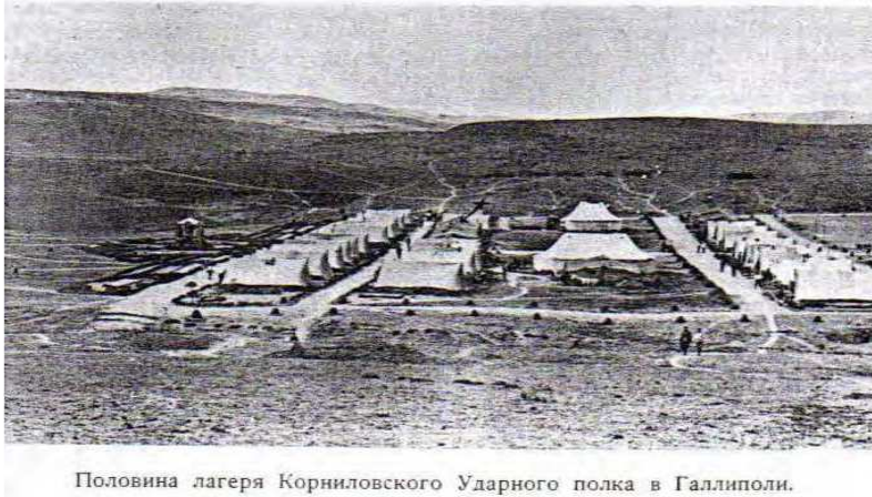
Resim 2: Kornilov Taarruz Alayının Gelibolu'daki kampının bir kısmının görüntüsü