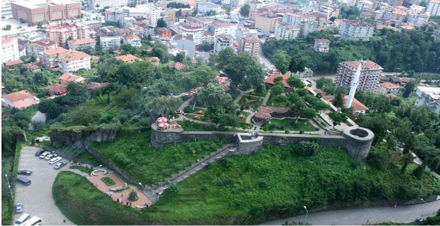
İç Kale ve Rize Kalesi Camii'nden Bir Görünüm ( http://www.rizekulturturizm.gov.tr/TR,127865/kaleler.html )

Rize Kalesi, etrafındaki Batum ve Trabzon kalelerine göre yaklaşık \frac{1}{4} oranında daha az askere sahiptir. XVIII. yüzyıl başlarında Batum Kalesi'nde 200-300 arasında yeniçeri mevcutken (Bostan 1992:210), Trabzon Kalesi'nde aynı dönemlerde ortalama 300-400 arasında kale kuvveti vardı (Öztürk 2011: 67-70). Bu bilgilerden bölgede yer alan kalelerdeki görevli sayısı dikkate alındığında, Rize Kalesi'nin daha az ehemmiyetli kaleler sınıfına girdiği rahatlıkla söylenebilir.